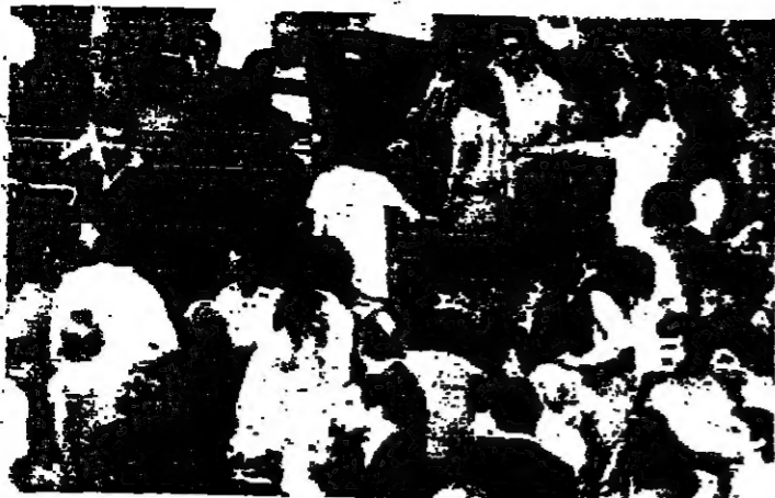
سيطر الدير على مشاهدي مباراة التنس في نورست هيلز بعد اصابت احد الفترين برصاصة في فخذه. وفي الصورة امرأة (ب) بالبليس ايبسش تشع الى رجلي پوليس يتفحصان الكرسي الذي اصيب فيه المشاهد وقد خلفت المباراة بين ادي ديسجوجون ماك ايتو لفترة قصيرة